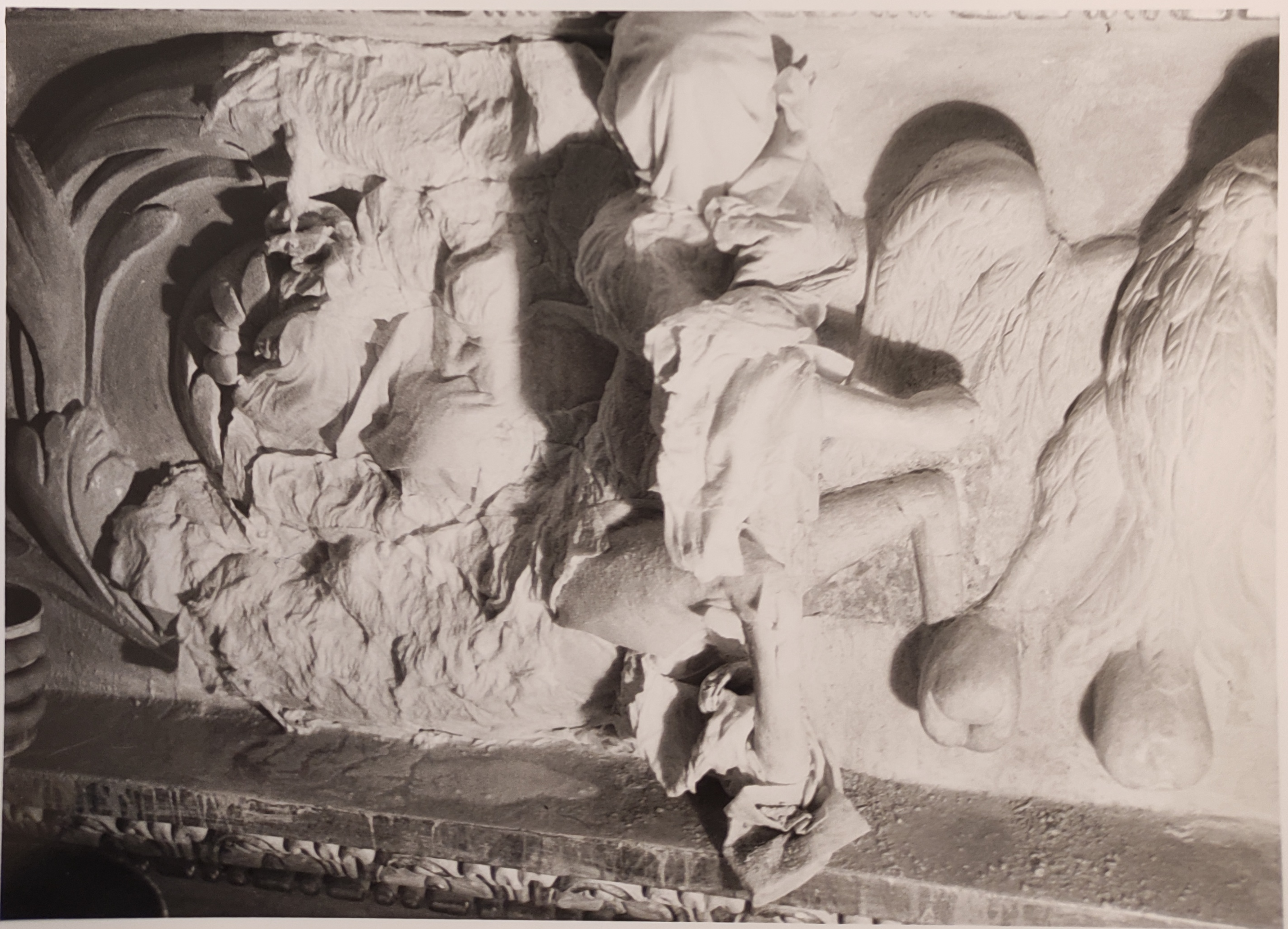
Španělský sál Pražského hradu stav při restaurování