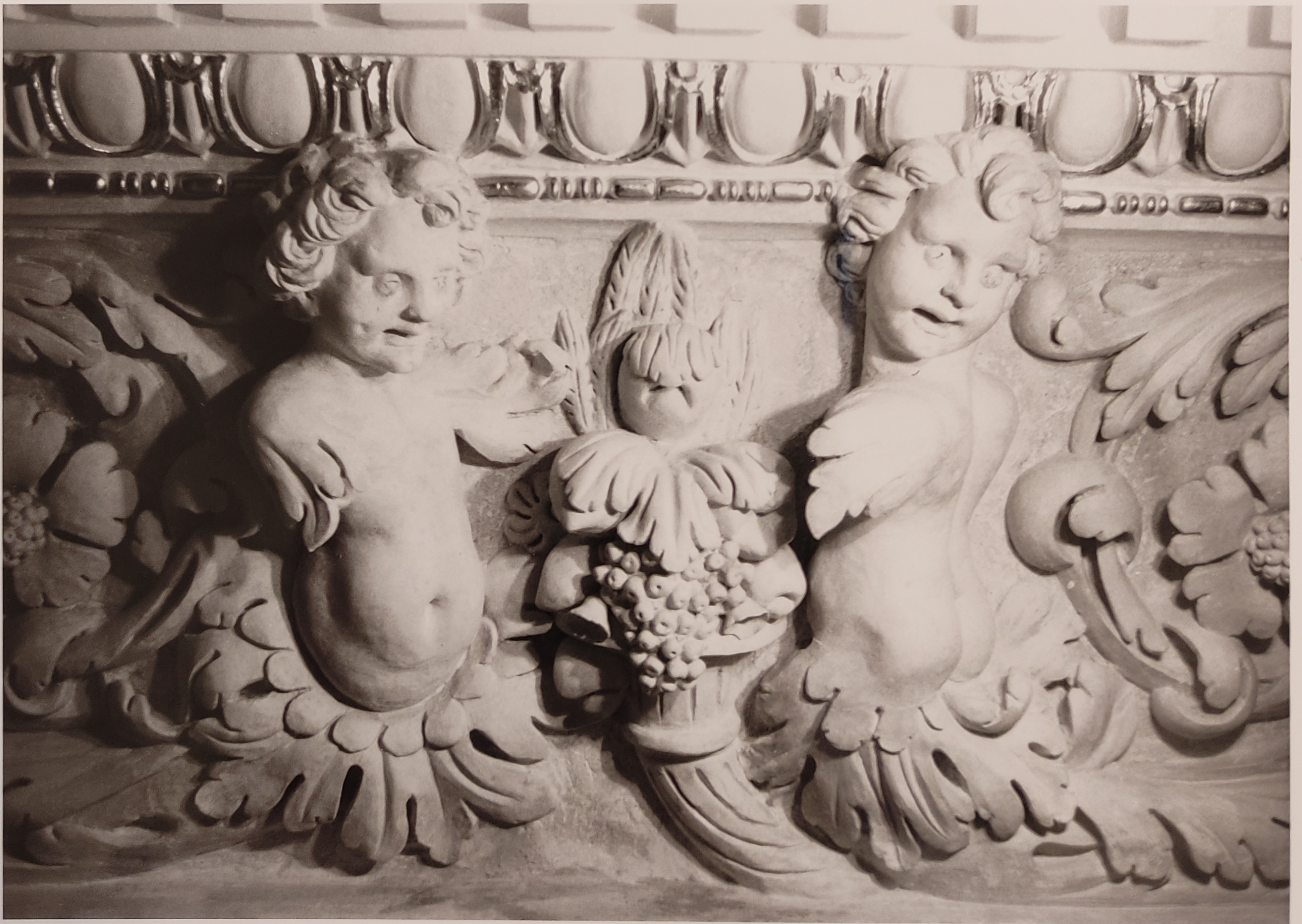
Španělský sál Pražského hradu stav po restaurování