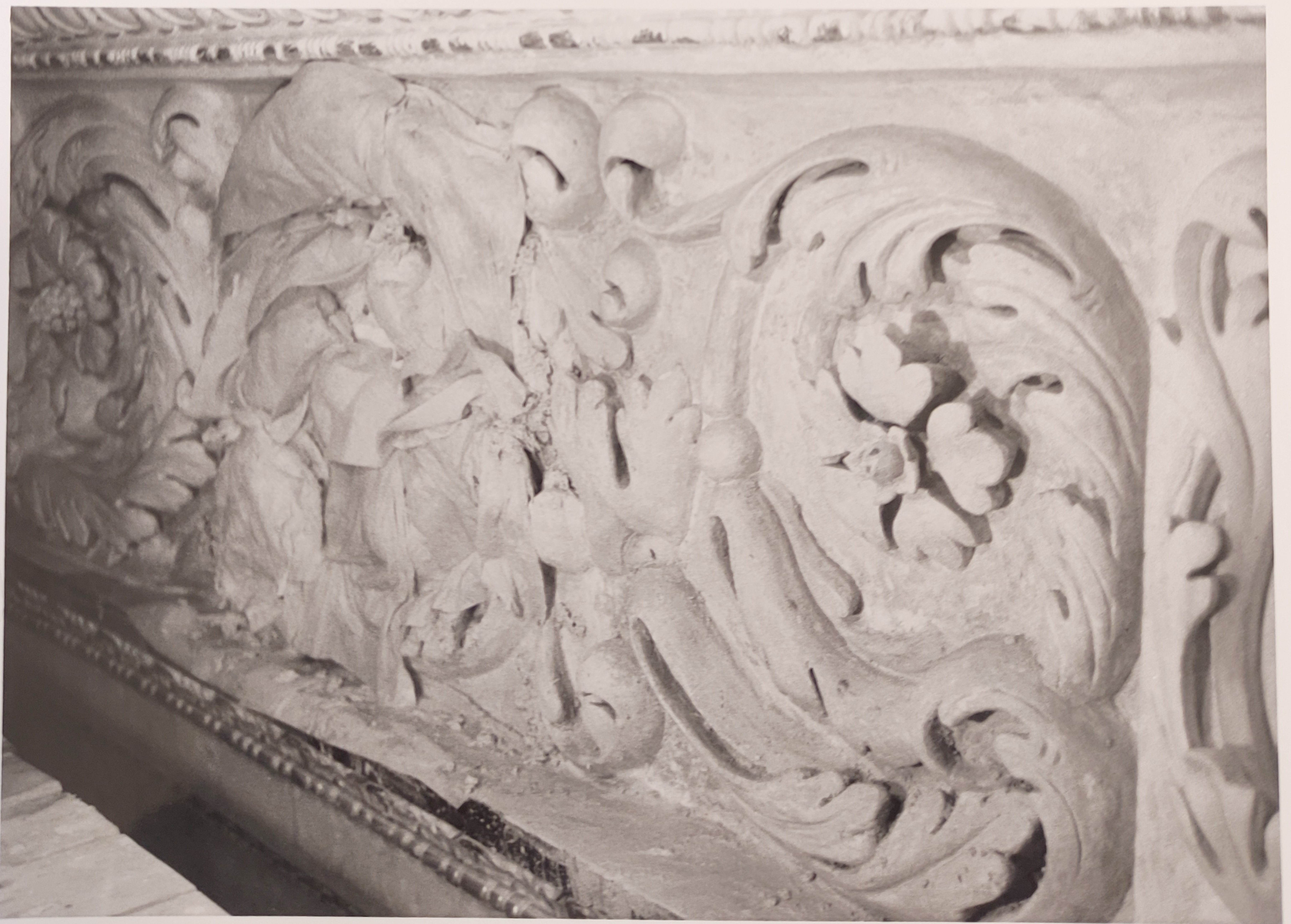
Španělský sál Pražského hradu stav při restaurování