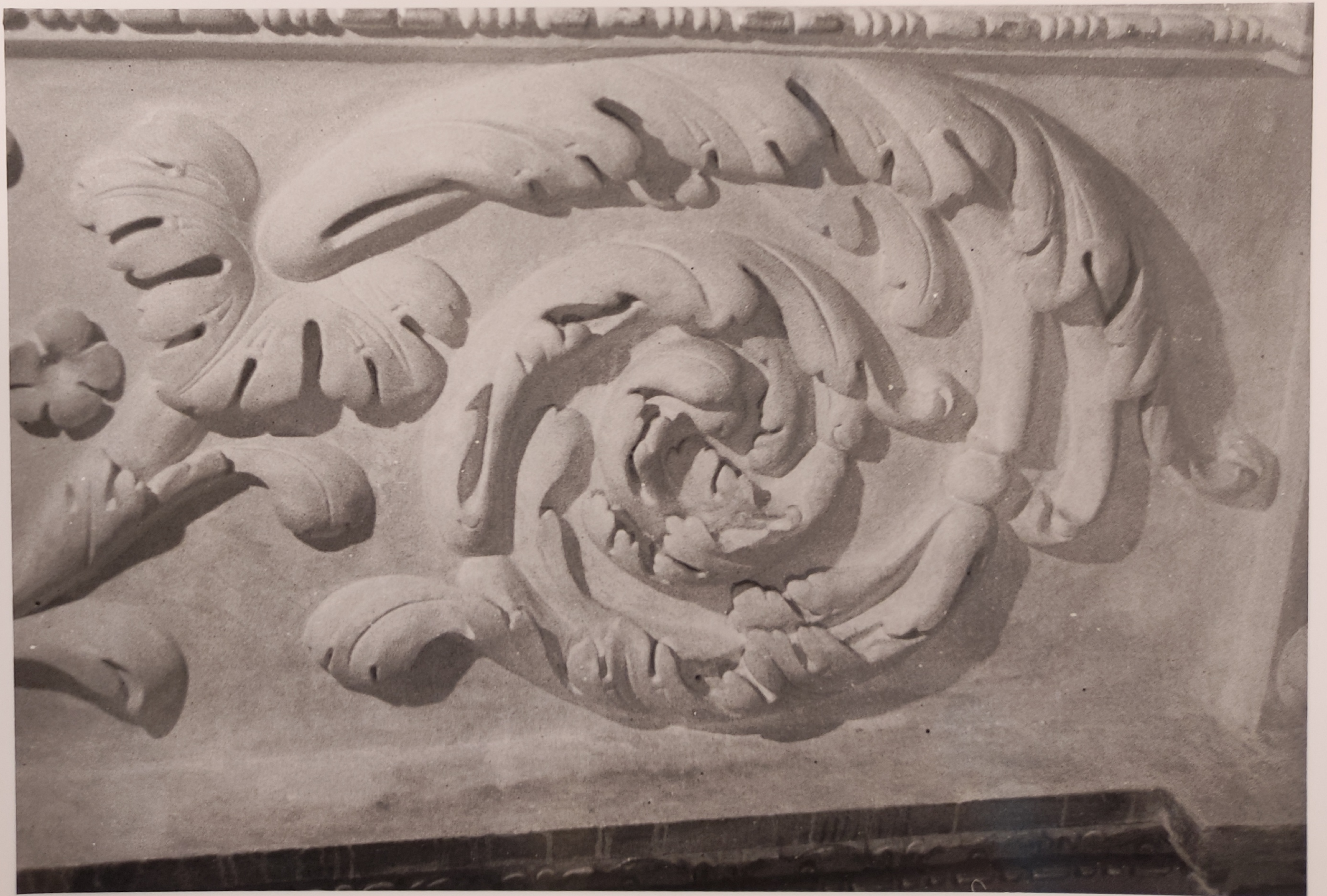
Španělský sál Pražského hradu stav po restaurování