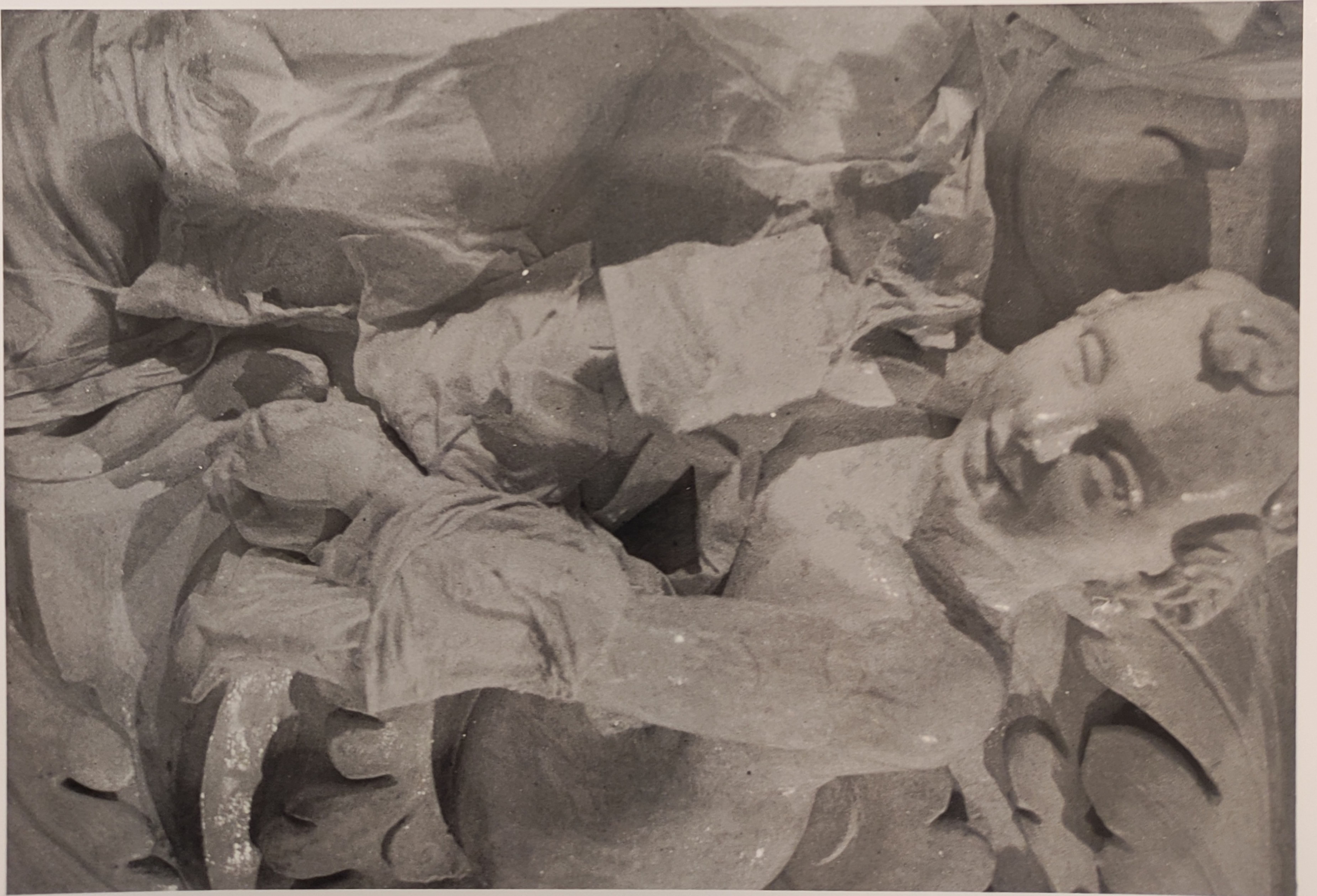
Španělský sál Pražského hradu stav při restaurování