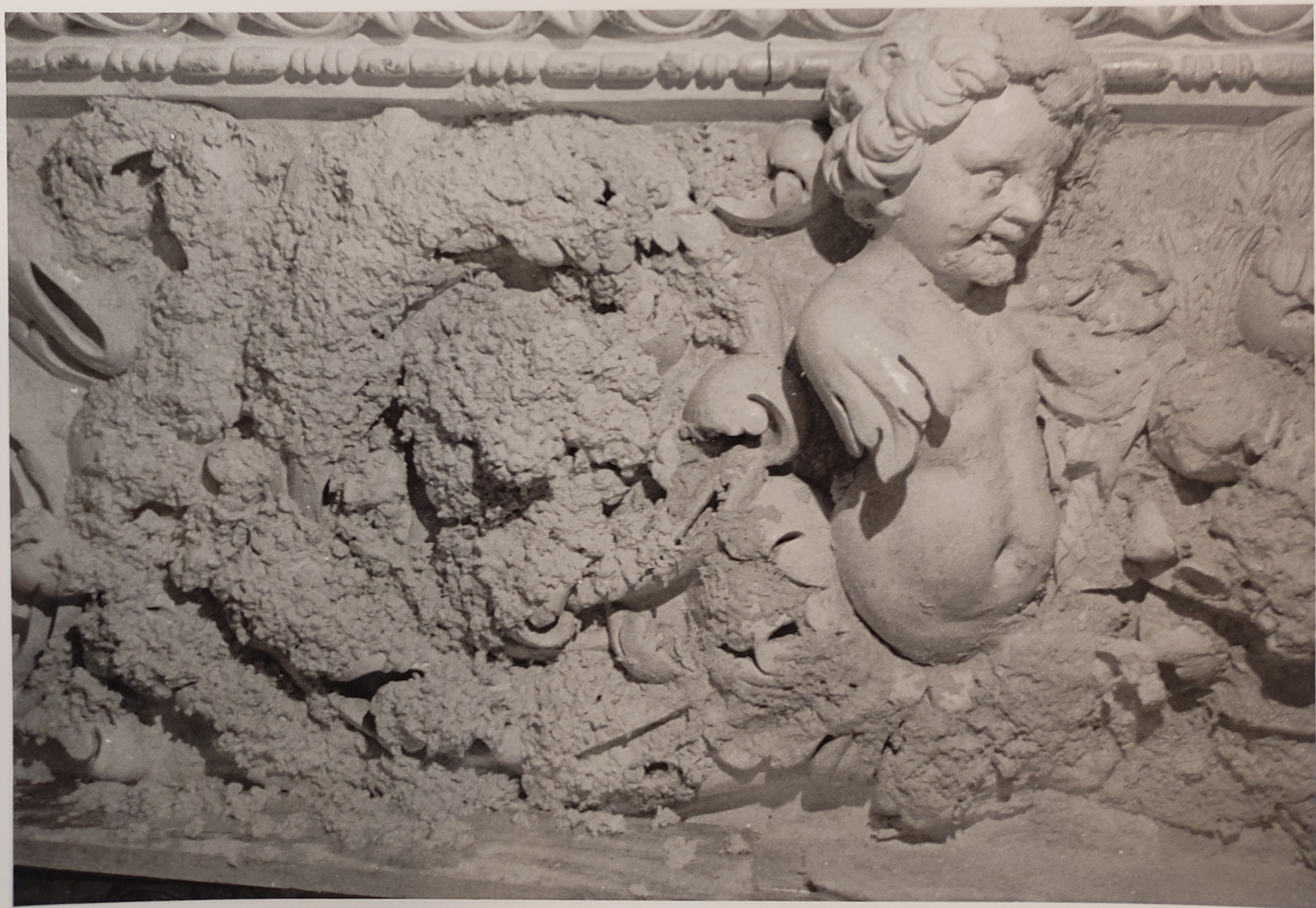
Španělský sál Pražského hradu stav při restaurování