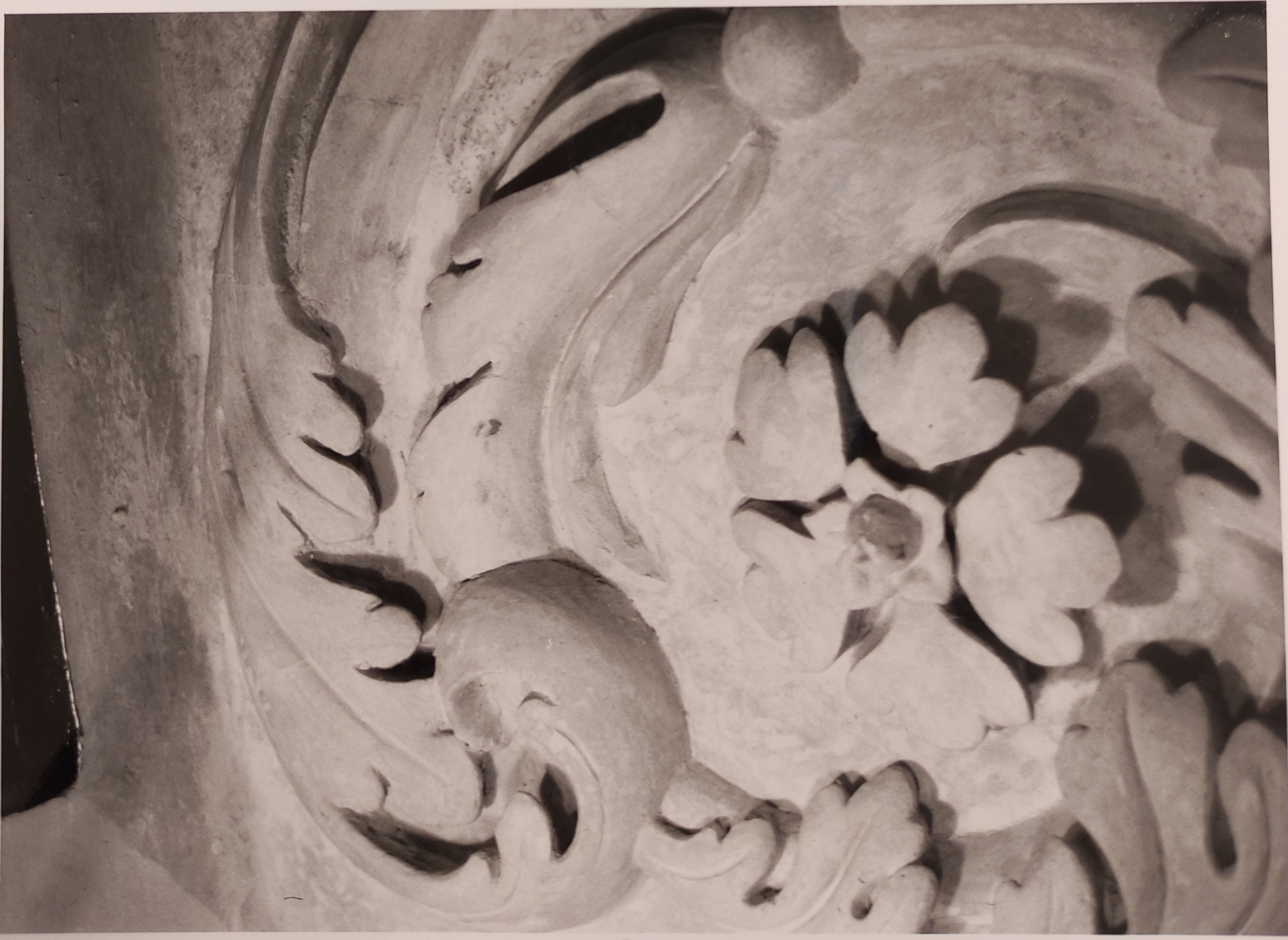
Španělský sál Pražského hradu stav po restaurování