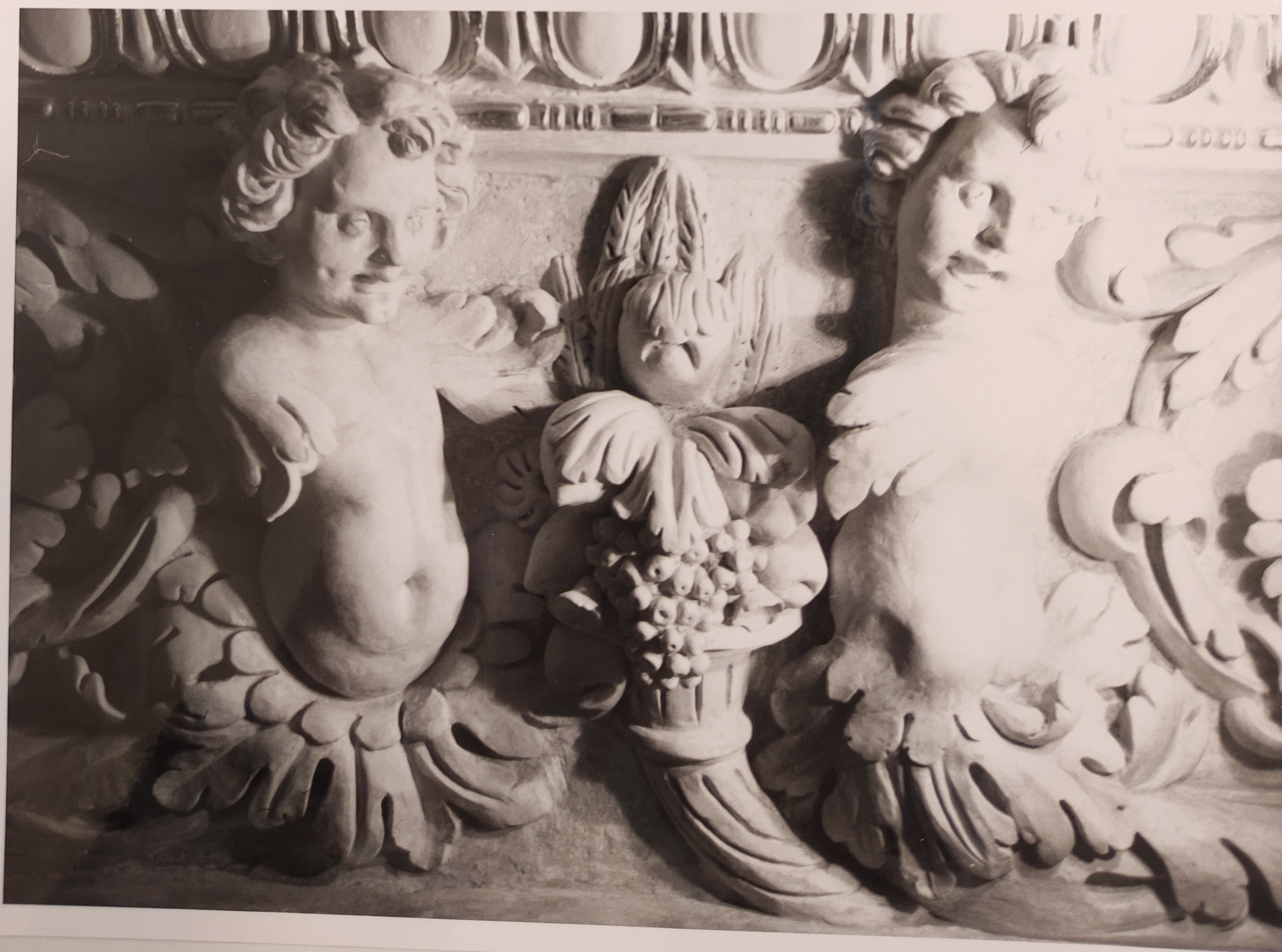
Španělský sál Pražského hradu stav po restaurování