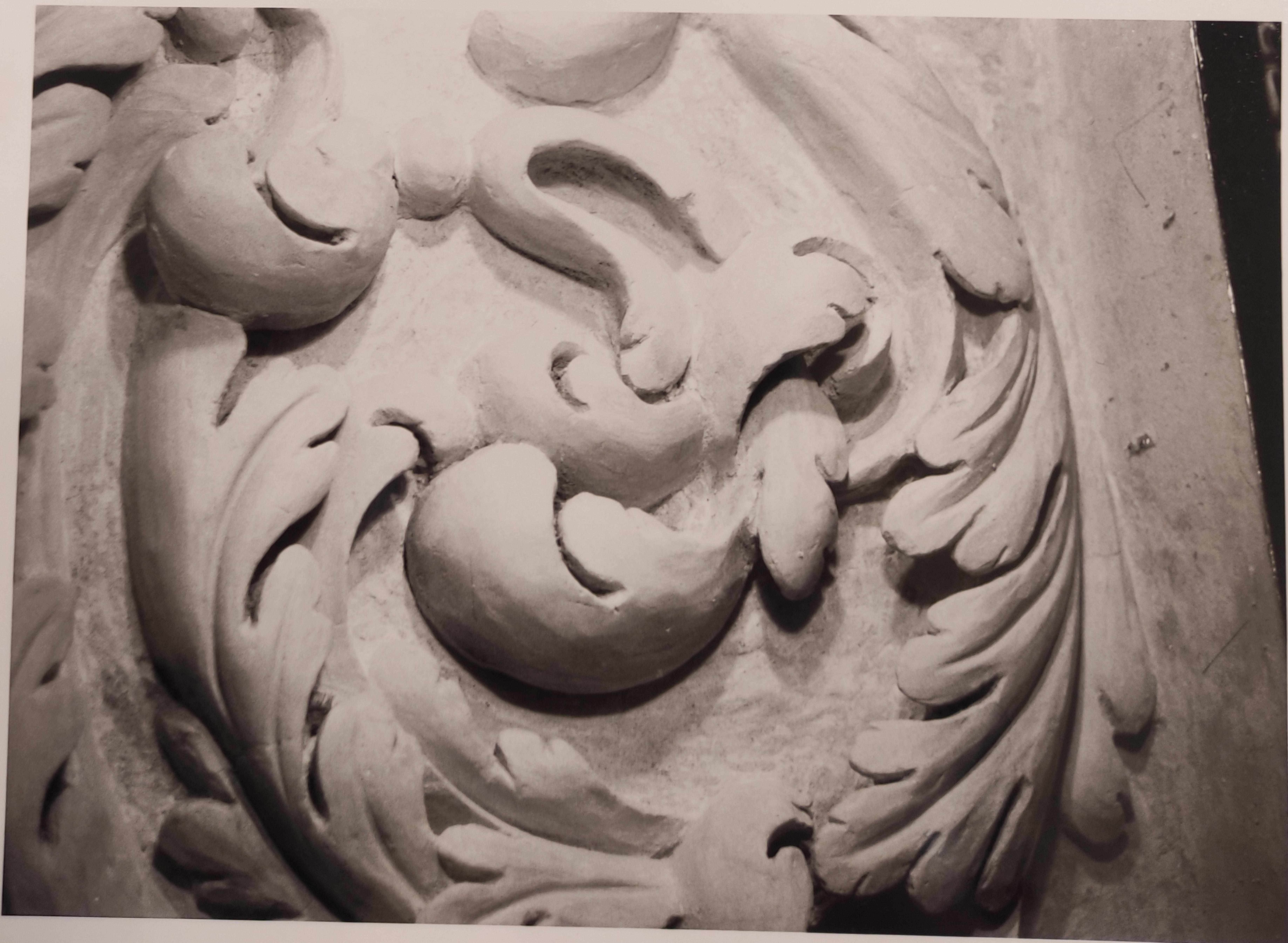
Španělský sál Pražského hradu stav po restaurování