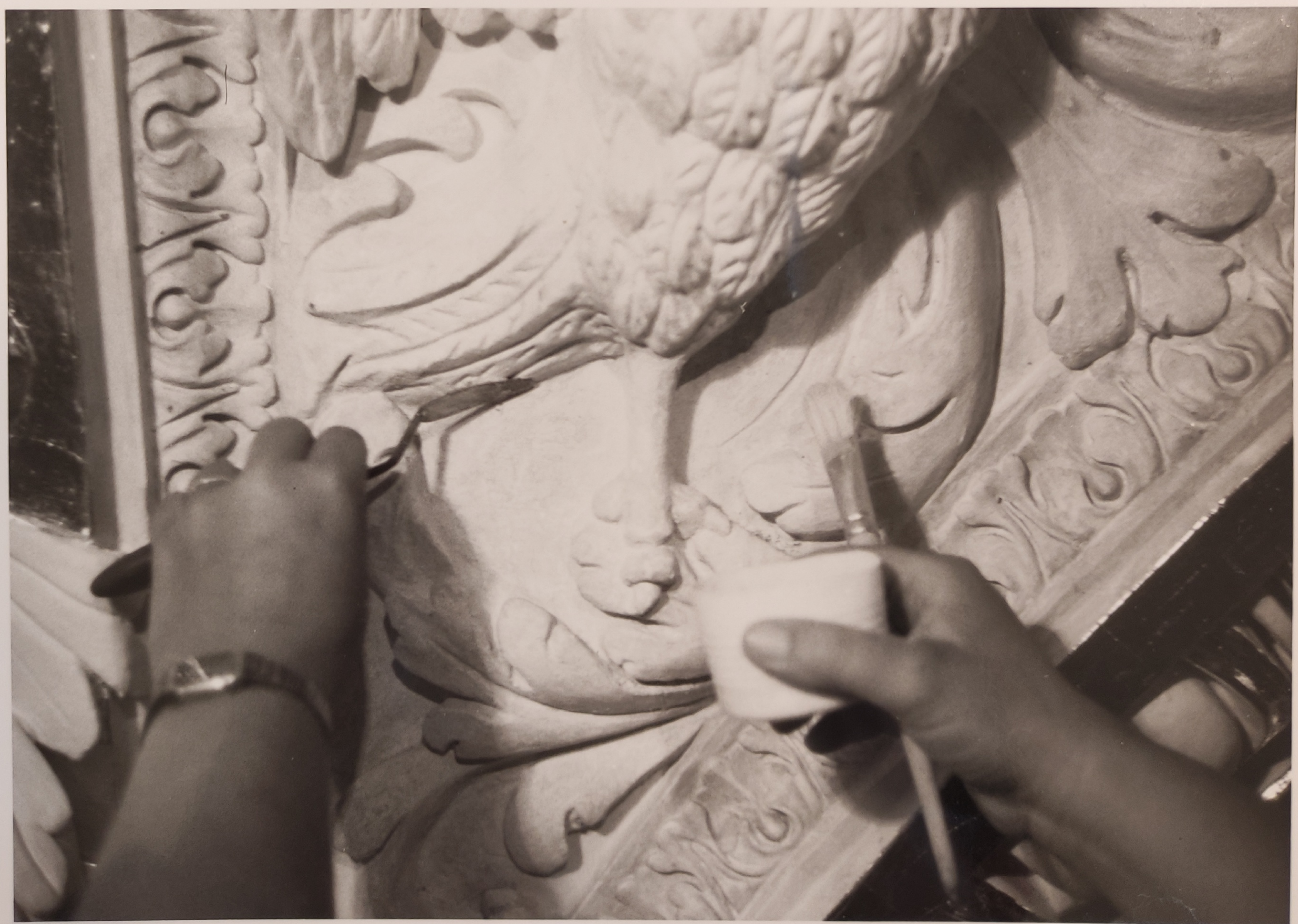
Španělský sál Pražského hradu stav při restaurování