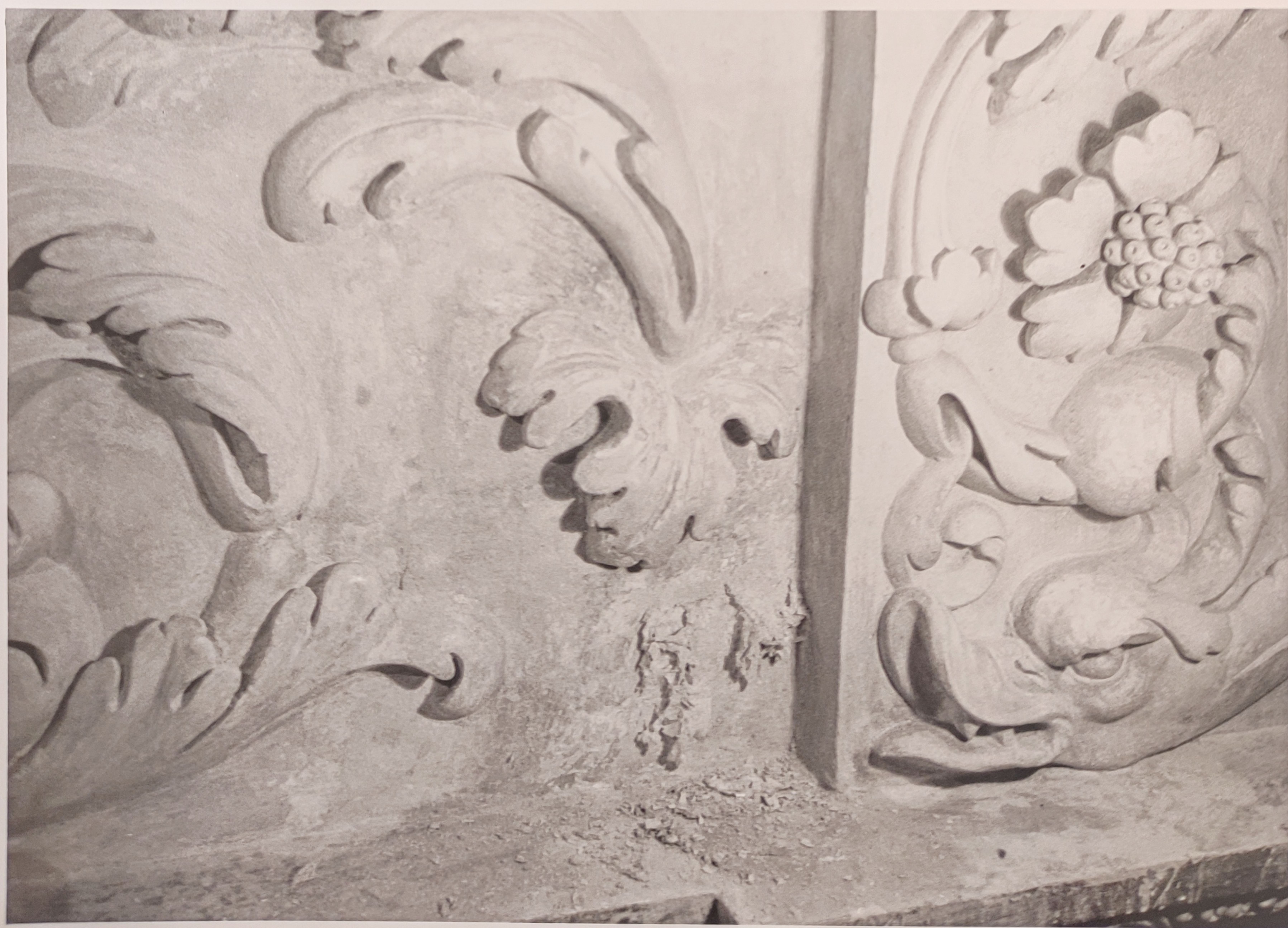
Španělský sál Pražského hradu stav při restaurování