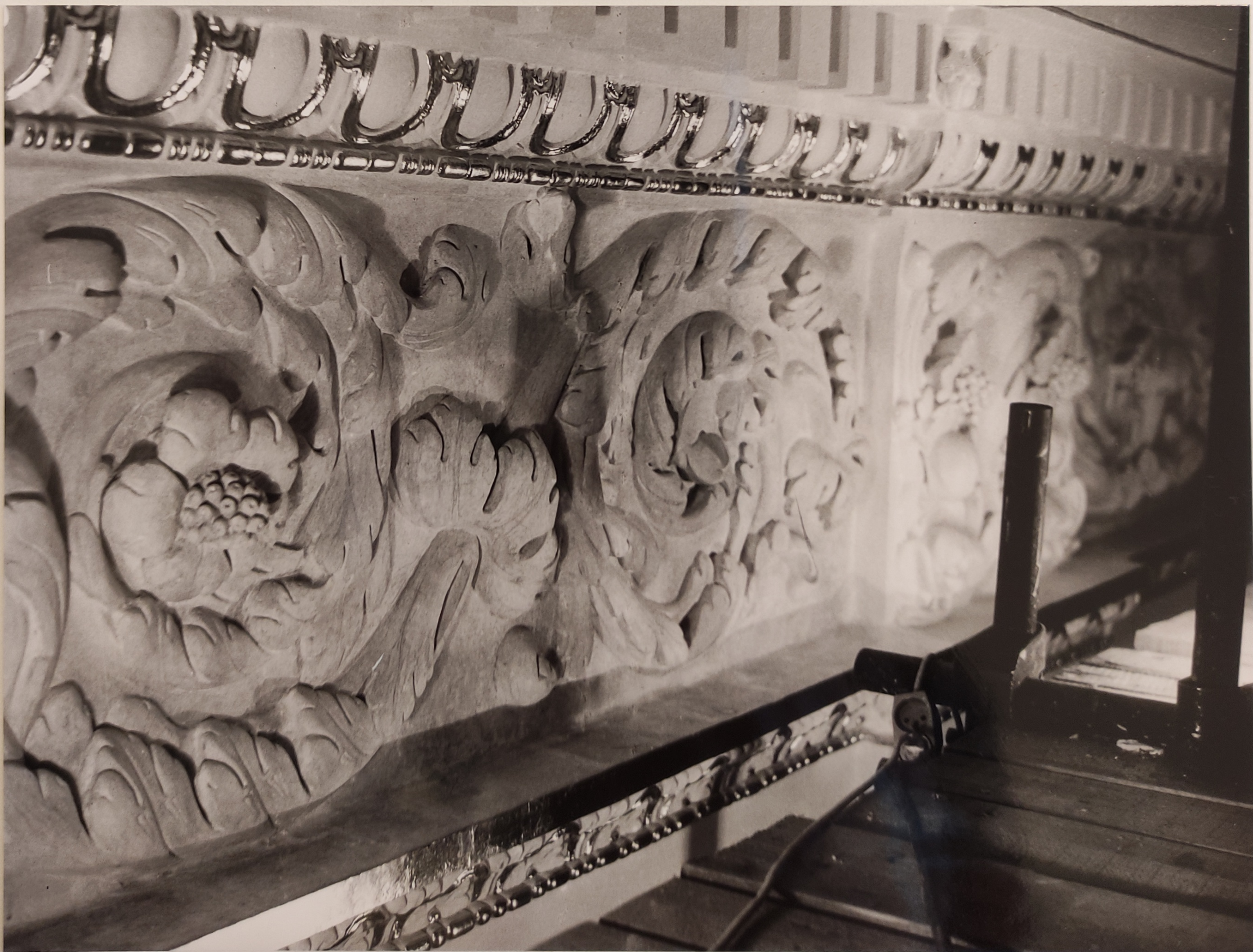
Španělský sál Pražského hradu stav po restaurování