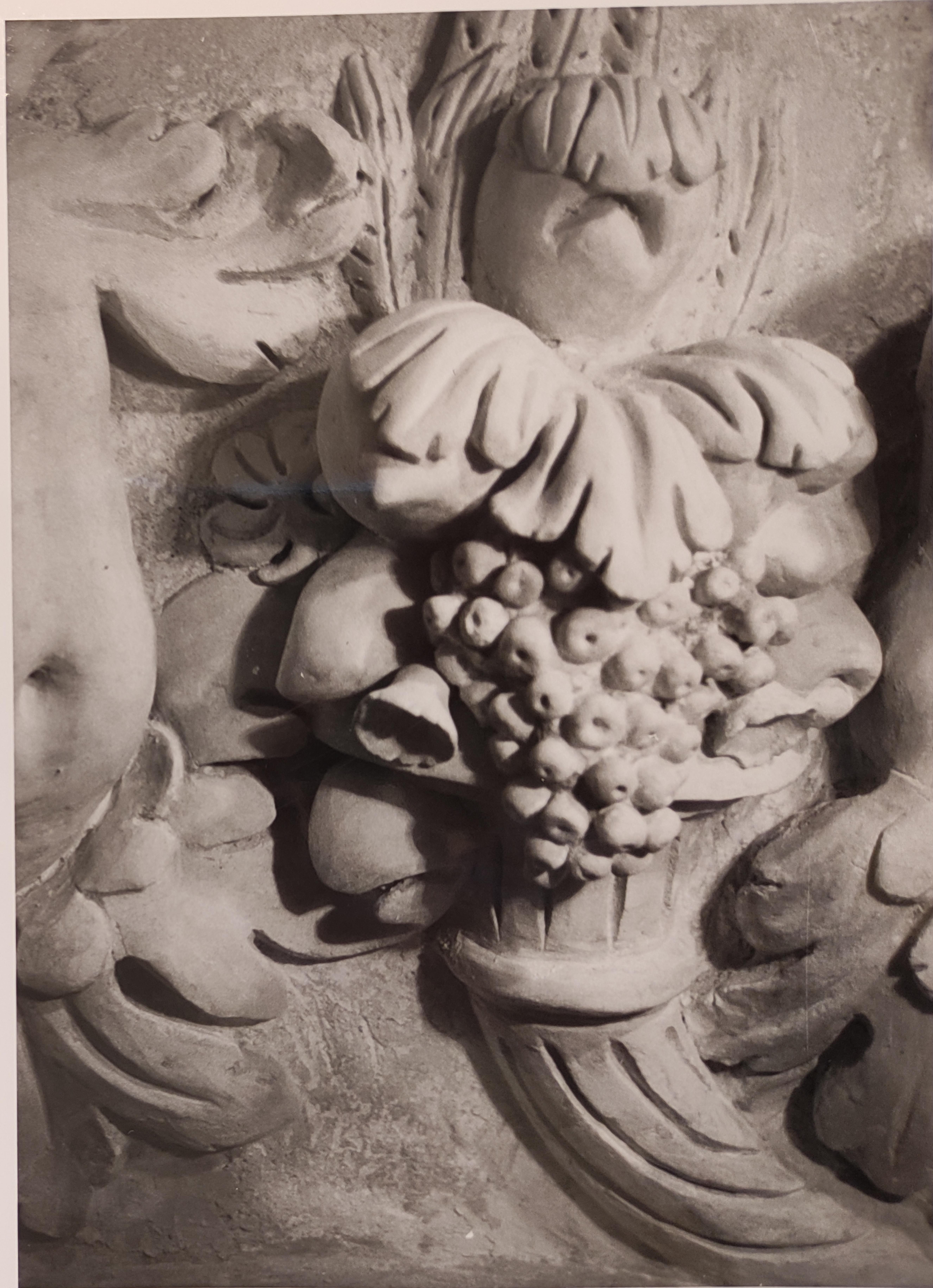
Španělský sál Pražského hradu stav po restaurování