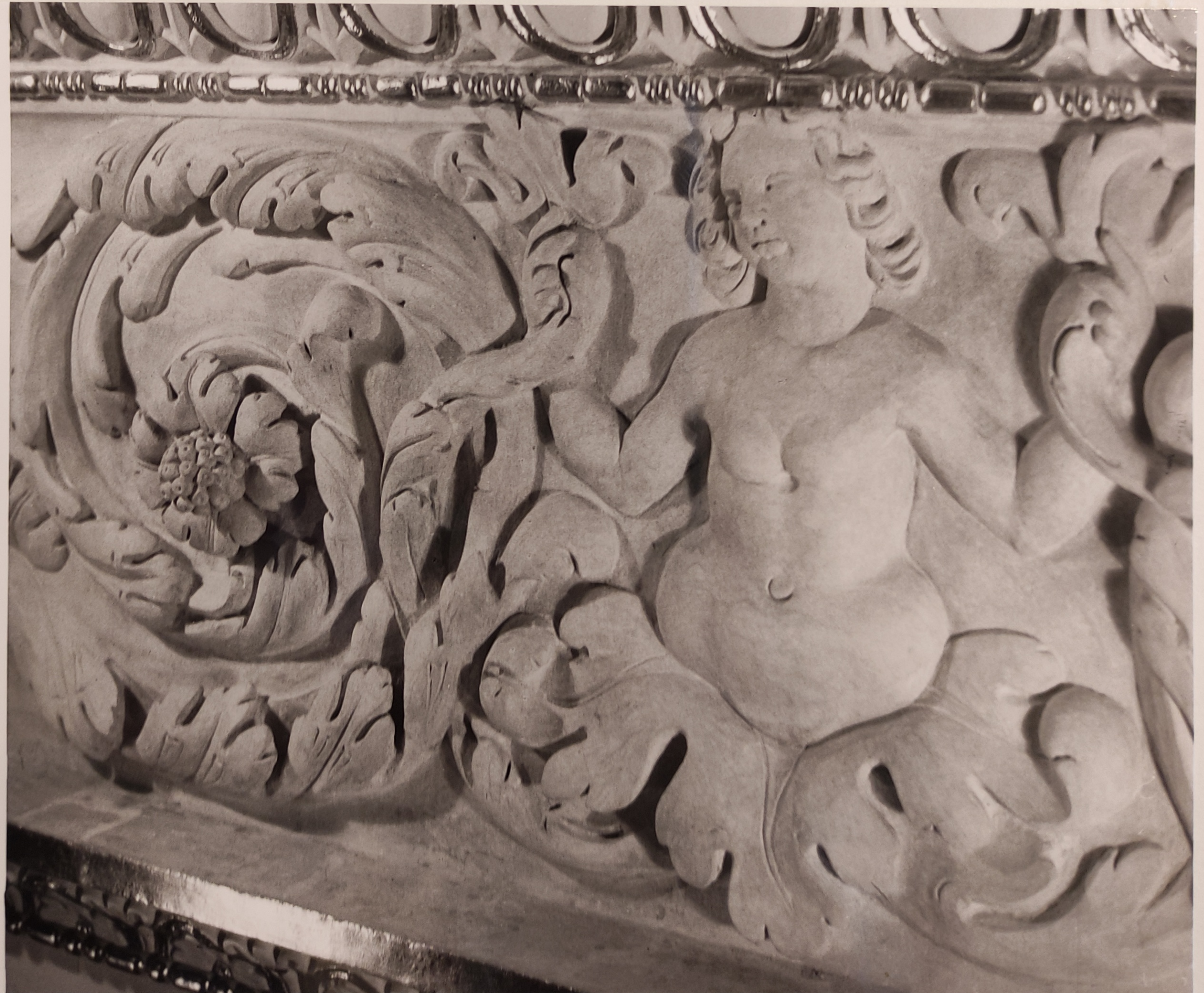
Španělský sál Pražského hradu stav po restaurování