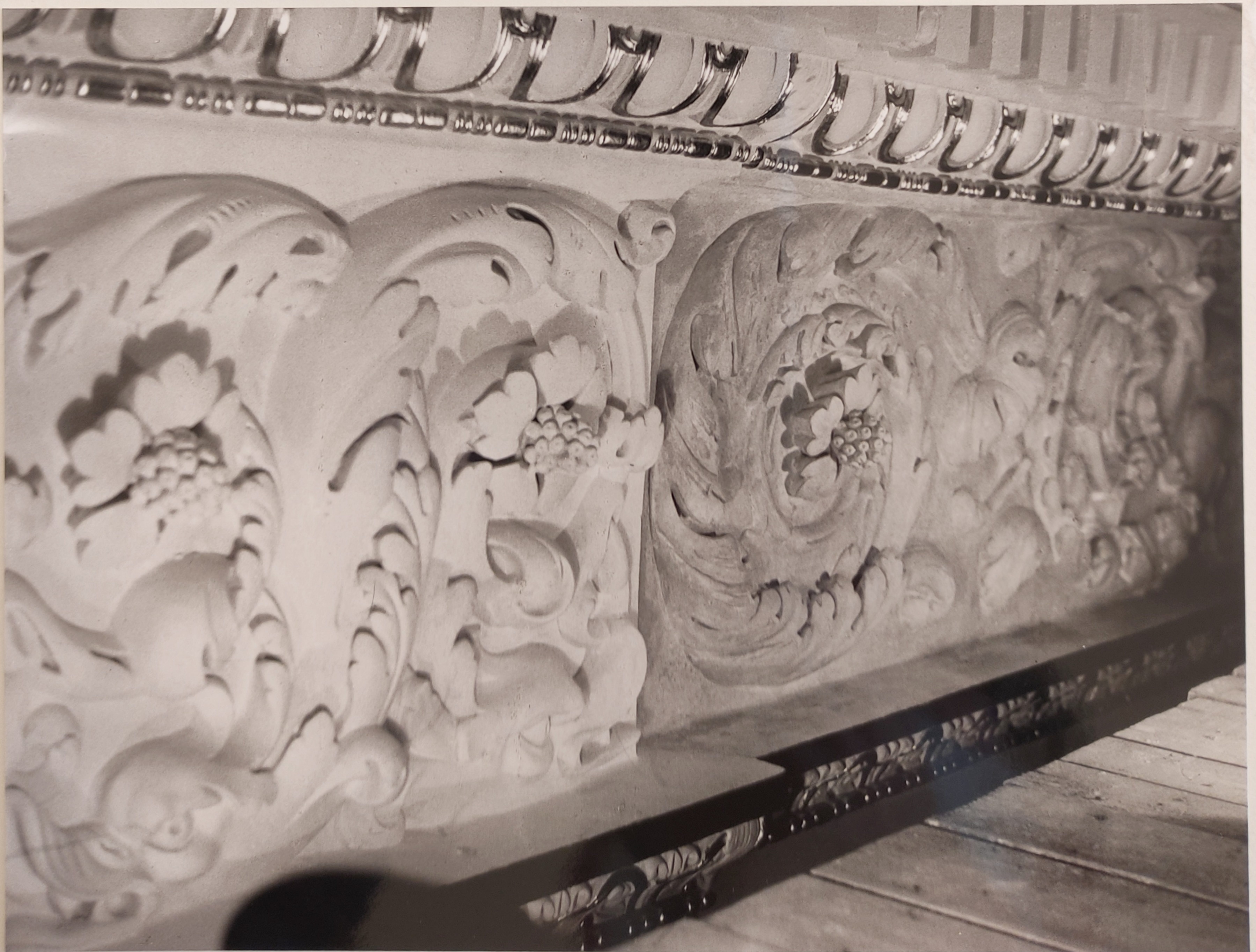
Španělský sál Pražského hradu stav po restaurování