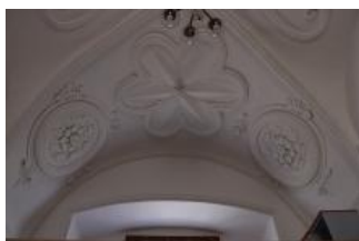
Tatenice, zámek, prostor v patře severního křídla, detail severní části klenby (Lucia Krajčirová, 2021)