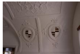
Tatenice, zámek, prostor v patře severního křídla, detail heraldické výzdoby (Lucia Krajčirová, 2021)