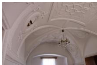
Tatenice, zámek, klenba prostoru v patře severního křídla, pohled k severu (Lucia Krajčirová, 2021)