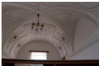
Tatenice, zámek, klenba prostoru v patře severního křídla, pohled k jihu (Lucia Krajčirová, 2021)