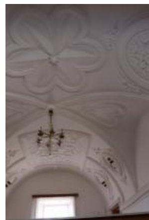
Tatenice, zámek, klenba prostoru v patře severního křídla, pohled k jihu (Lucia Krajčirová, 2021)