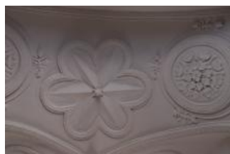
Tatenice, zámek, prostor v patře severního křídla, detail rozety a hvězdy (Lucia Krajčirová, 2021)