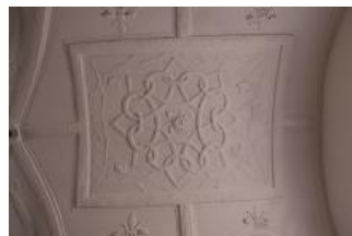
Tatenice, zámek, prostor v patře severního křídla, detail centrálního zrcadla (Lucia Krajčirová, 2021)