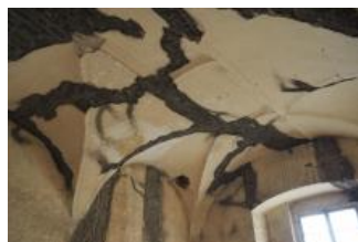
Brtnice, zámek, klenba místnosti 1. patra (Zdeňka Michalová, 2020)