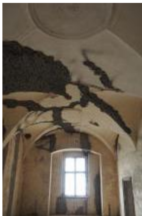
Brtnice, zámek, klenba místnosti 1. patra (Zdeňka Michalová, 2020)