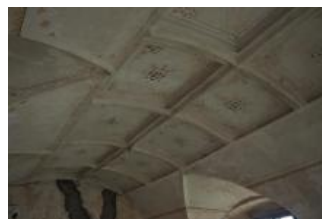
Brtnice, zámek, klenba místnosti 1. patra (Zdeňka Michalová, 2020)