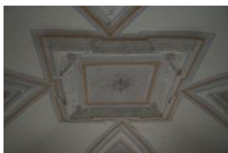
Brtnice, zámek, klenba místnosti 1. patra (Zdeňka Michalová, 2020)