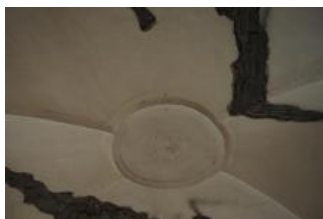
Brtnice, zámek, klenba místnosti 1. patra (Zdeňka Michalová, 2020)