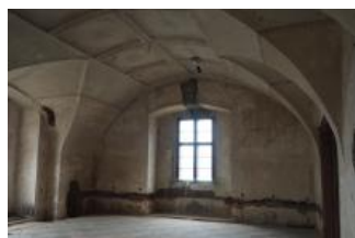
Brtnice, zámek, klenba místnosti 1. patra (Zdeňka Michalová, 2020)