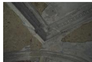
Brtnice, zámek, klenba místnosti 1. patra (Zdeňka Michalová, 2020)