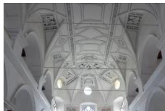
Mladá Boleslav, sbor českých bratří, klenba s lunetami - část loďe a presbytář (Pavla Mikešová, květen 2018)