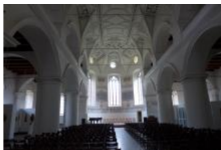
Mladá Boleslav, sbor českých bratří, pohled do hlavní lodi, klenba (Pavla Mikešová, květen 2018)