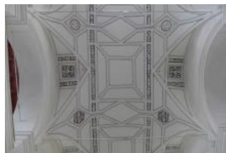
Mladá Boleslav, sbor českých bratří, klenební pole v hlavní lodi (Pavla Mikešová, květen 2018)