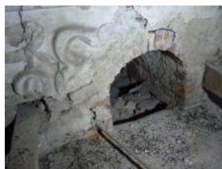
Račice, zámek, jihovýchodní křídlo (půda), korunní římsa (Lucia Krajčířová, 2020)