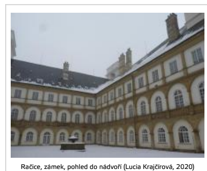
Račice, zámek, pohled do nádvoří (Lucia Krajčířová, 2020)