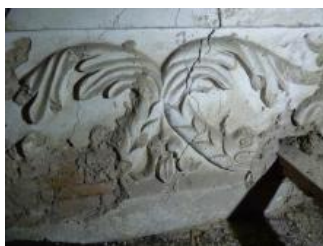
Račice, zámek, jihovýchodní křídlo (půda), korunní římsa, detail s rybami (Lucia Krajčířová, 2020)