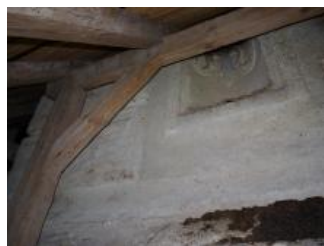
Račice, zámek, jihovýchodní křídlo (půda), reliéfní nika se zbytky polychromie (Lucia Krajčířová, 2020)