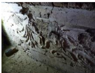
Račice, zámek, jihovýchodní křídlo (půda), korunní římsa (Lucia Krajčířová, 2020)