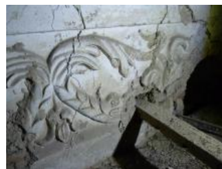
Račice, zámek, jihovýchodní křídlo (půda), korunní římsa, detail s rybami (Lucia Krajčířová, 2020)