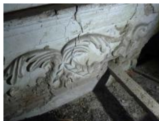
Račice, zámek, jihovýchodní křídlo (půda), korunní římsa, detail s rybami (Lucia Krajčířová, 2020)