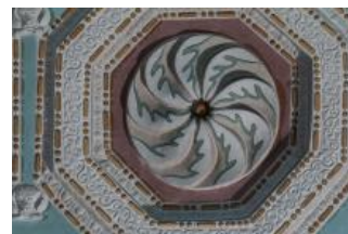
Běhařovice, kostel Nejsvětější Trojice, klenba presbytáře, detail rozety (Vojtěch Krajíček, 2020)