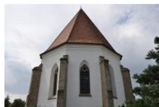
Běhařovice, kostel Nejsvětější Trojice, exteriér (Zdeňka Míchalová, 2018)