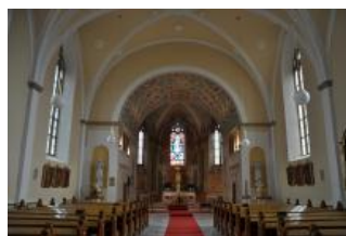
Běhařovice, kostel Nejsvětější Trojice, pohled směrem k presbytáři (Zdeňka Michalová, 2018)