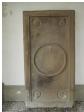
Běhařovice, kostel Nejsvětější Trojice, krycí deska hrobky s letopočtem 1597 a iniciálami Georga Christiana Teufela (Zdeňka Míchalová, 2018)