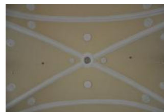
Běhařovice, kostel Nejsvětější Trojice, klenba lodi (Zdeňka Michalová, 2018)