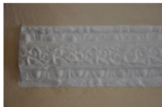
Běhařovice, kostel Nejsvětější Trojice, klenba předsíně, detail (Zdeňka Míchalová, 2018)