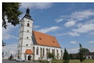
Běhařovice, kostel Nejsvětější Trojice, exteriér (Zdeňka Míchalová, 2018)