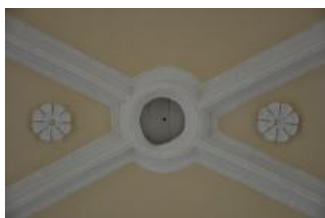
Běhařovice, kostel Nejsvětější Trojice, klenba lodi, detail dekorace (Zdeňka Michalová, 2018)