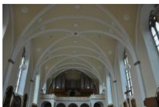
Běhařovice, kostel Nejsvětější Trojice, klenba lodi