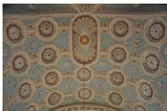
Běhařovice, kostel Nejsvětější Trojice, klenba presbytáře (Zdeňka Michalová, 2018)