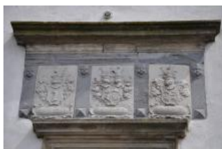
Běhařovice, kostel Nejsvětější Trojice, erby Evy Tavíkovické z Tavíkovíc, Georga Christiana Teufela a Markéty Brtnické z Valdštejna umístěné nad vstupem do věže (Zdeňka Míchalová, 2018)