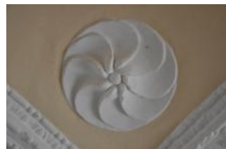
Běhařovice, kostel Nejsvětější Trojice, klenba předsíně, detail (Zdeňka Míchalová, 2018)