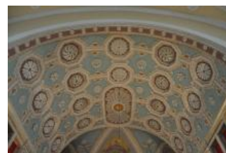
Běhařovice, kostel Nejsvětější Trojice, klenba presbytáře (Zdeňka Michalová, 2018)