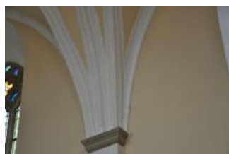
Běhařovice, kostel Nejsvětější Trojice, klenba lodi, detail klenebního výběhu (Zdeňka Michalová, 2018)