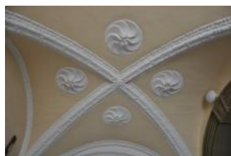
Běhařovice, kostel Nejsvětější Trojice, klenba předsíně (Zdeňka Michalová, 2018)