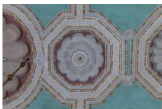
Běhařovice, kostel Nejsvětější Trojice, klenba presbytáře, detail rozety (Vojtěch Krajíček, 2020)