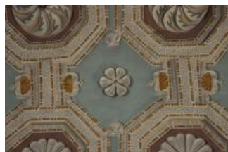
Běhařovice, kostel Nejsvětější Trojice, klenba presbytáře (Zdeňka Michalová, 2018)