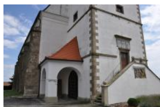
Běhařovice, kostel Nejsvětější Trojice, exteriér (Zdeňka Míchalová, 2018)