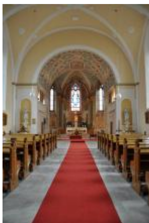
Běhařovice, kostel Nejsvětější Trojice, pohled směrem k presbytáři (Zdeňka Michalová, 2018)