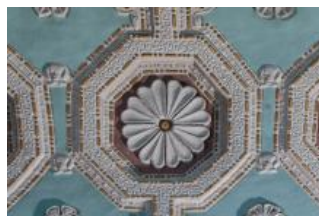
Běhařovice, kostel Nejsvětější Trojice, klenba presbytáře, detail rozety (Vojtěch Krajíček, 2020)