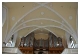
Běhařovice, kostel Nejsvětější Trojice, klenba lodi (Zdeňka Michalová, 2018)