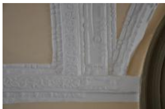
Běhařovice, kostel Nejsvětější Trojice, klenba předsíně, detail (Zdeňka Míchalová, 2018)