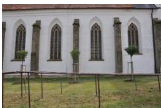
Běhařovice, kostel Nejsvětější Trojice, exteriér (Zdeňka Míchalová, 2018)