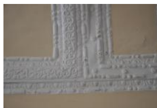
Běhařovice, kostel Nejsvětější Trojice, klenba předsíně, detail (Zdeňka Michalová, 2018)