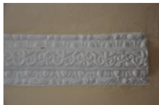
Běhařovice, kostel Nejsvětější Trojice, klenba předsíně, detail (Zdeňka Míchalová, 2018)