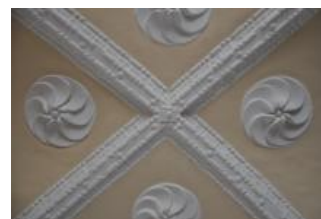
Běhařovice, kostel Nejsvětější Trojice, klenba předsíně, detail (Zdeňka Michalová, 2018)