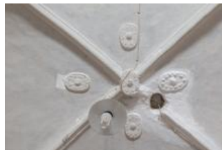
Svitavy, kostel sv. Jiljí, klenba předsíně se štukovými dekory (Vojtěch Krajiček, srpen 2018)