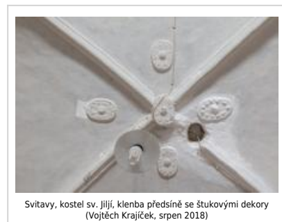
Svitavy, kostel sv. Jiljí, klenba předsíně se štukovými dekory (Vojtěch Krajiček, srpen 2018)