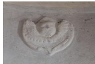
Svitavy, kostel sv. Jiljí, jeden ze čtyř štukových serafů (Vojtěch Krajiček, srpen 2018)