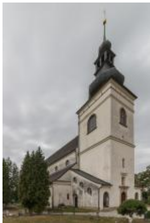
Svitavy, kostel sv. Jiljí (Vojtěch Krajiček, srpen 2018)