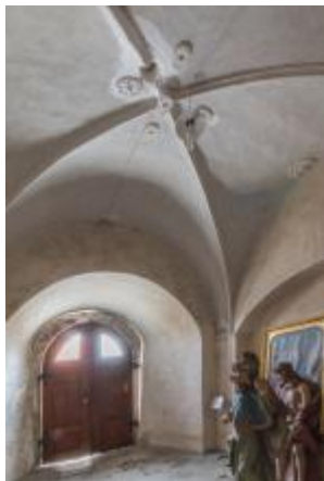
Svitavy, kostel sv. Jiljí, vstupní předsíň (Vojtěch Krajiček, srpen 2018)