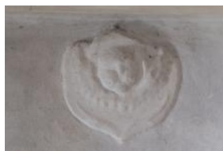
Svitavy, kostel sv. Jiljí, jeden ze čtyř štukových serafů (Vojtěch Krajiček, srpen 2018)