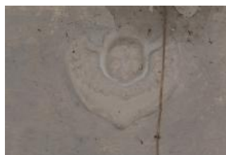
Svitavy, kostel sv. Jiljí, jeden ze čtyř štukových serafů (Vojtěch Krajiček, srpen 2018)