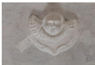
Svitavy, kostel sv. Jiljí, jeden ze čtyř štukových serafů (Vojtěch Krajiček, srpen 2018)